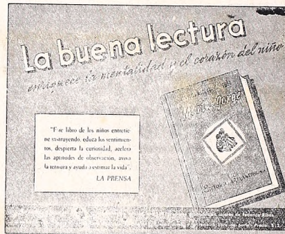
Si no lo tiene su librero, pídale a Casa Atlántida, Florida 643, Buenos Aires, y lo recibirá libre de porte. Precio: $ 2.-

Por decreto del P. E. se ha dispuesto que la policía de los territorios nacionales otorgue en forma gratuita las cédulas de identidad y certificados de conducta que con fines de trabajo le soliciten las personas domiciliadas en su jurisdicción. No se cobrará en adelante ningún arancel ni sellados en tales casos.